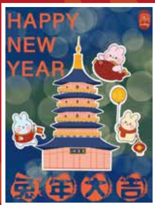
《兔年大吉》电子手绘画

新春之际，景区举办“新年福利之云端祈福”线上活动，收到了广大粉丝的热情留言与投稿，一起来欣赏优秀作品吧！