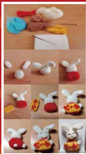
《平安兔》羊毛毡手作