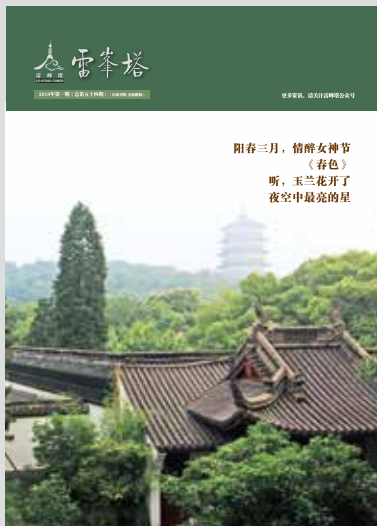
2018年第一期（总第五十四期） （内部刊物 交流赠阅）

《意见》要求，各地区、各部门要充分认识发展全域旅游的重大意义，确保全域旅游工作取得实效，实现旅游发展全域化、旅游供给品质化、旅游治理规范化、旅游效益最大化等目标。